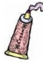
ยาทาภายนอก