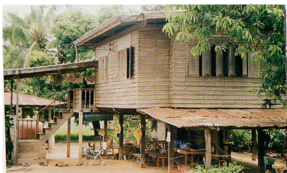
A typical Village home built on stilts in the rural area.

It is worth pointing out that many cheap hotels double as brothels and even many of the cheaper 'straight' hotels are used primarily for assignations. So, if you are greeted by a puzzled look when you arrive alone and ask for a room for a week, you have probably chosen the wrong hotel!