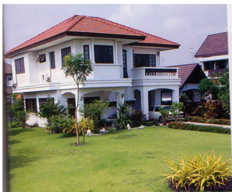
Modern, middle class families live differently from families in rural villages.