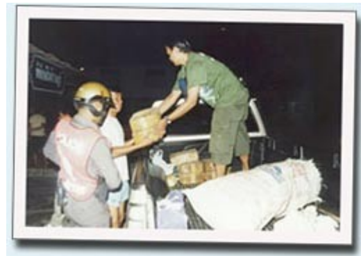
ยาบ้า จำนวน 1,268,000 เม็ด ยึดไว้เป็น ของกลาง