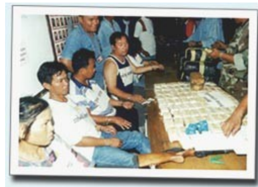
เจ้าหน้าที่ตำรวจตรวจนับของกลางที่ยึดได้