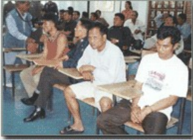
กวาดล้างกลุ่มผู้มีอิทธิพล และมีมือปืนรับจ้างก่อนการเลือกตั้ง สส.ในพื้นที่จังหวัดเพชรบูรณ์