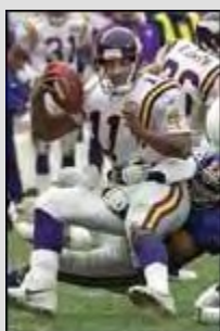
คัลเบปเปอร์ เล่นไม่ออก

เคอร์รี่ คอลลินส์ ขว้างบอมบ์อย่างแม่นยำ ปลดปล่อยขลุ่ยปีกอย่าง แรนต์ มอส และ คริส คาร์เตอร์ เป็นฝ่ายที่ทำได้แค่มองดู เพราะทีมรับของไจแอนท์ส เองก็จัดฟอร์ม สดุดอดนำทีมฝั่งไวกิ้งส์จมนดิน 41-0 คอลลินส์ ขว้าง 381 หลา 5 ทัชดาวน์ ซึ่งเป็น 34 แต้มในครั้งแรกก่อน ถล่มเอาชนะ มินเนโซตา ไปแบบราบคาบ 41-0 เข้าไปรอ พบคู่ชชนะ ระหว่างบัลติมอร์ กับ เอ็ดแลนด์ ในซูเปอร์โบวล์ ครั้งที่ 35 วันที่ 28 มกราคมนี้ ความพ่ายแพ้ในเกมนี้ เป็นการแพ้แบบเกมศูนย์ เป็นครั้งแรก ตลอด การคุมทีม 9 ปี ของเดนนิส กริน และเป็นความพ่ายแพ้ตลอด 4 เกม ที่พวกเขาเข้ามาชิงแชมป์สาย อุดเข้า ซูเปอร์โบวล์มาตั้งแต่ปี 1977