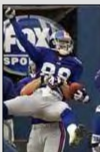
ซิลเลียต ฉลองทัชดาวน์