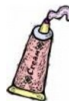
ยาทาภายนอก