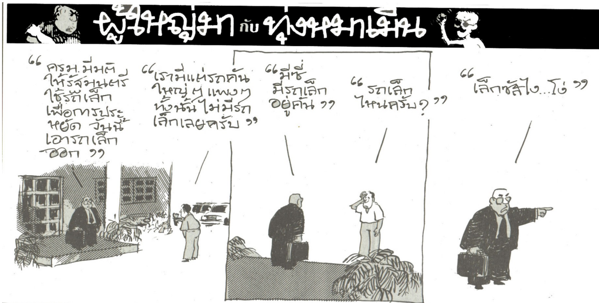
ผู้ใหญ่มากับทุงหมาเดิน

“กรม.มีมติ ให้รัฐมนตรี ใช้รถเล็ก เพื่อการประ หยัด วันนี้ เอารถเล็ก ออก”