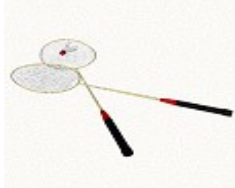
แบดมินตัน